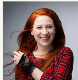
Siri Kolu Kirjailija